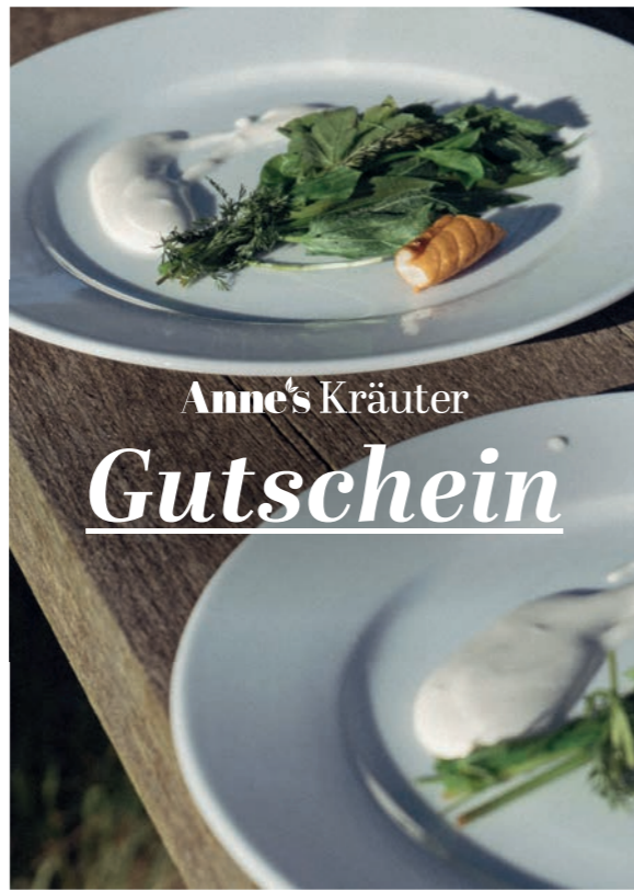
7 - „Ostseeteller“