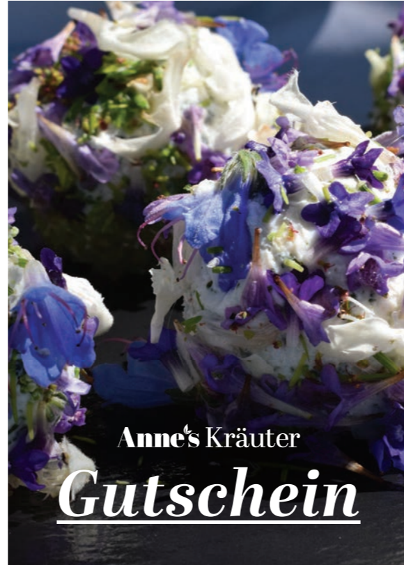
3 - „Gundermann“