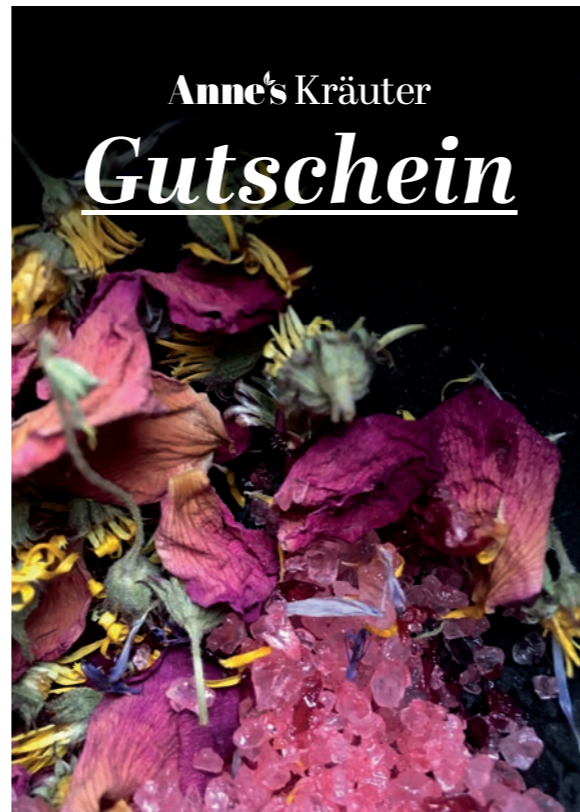
8 - „Wildrose“