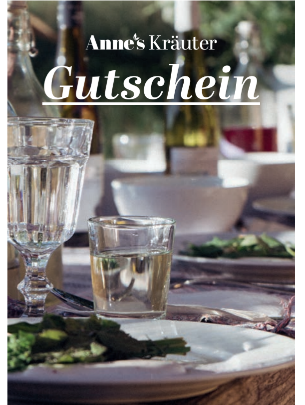
5 - „Sommer“