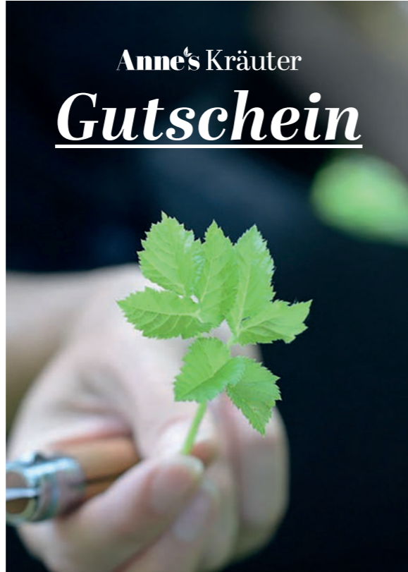
2 - „Giersch“