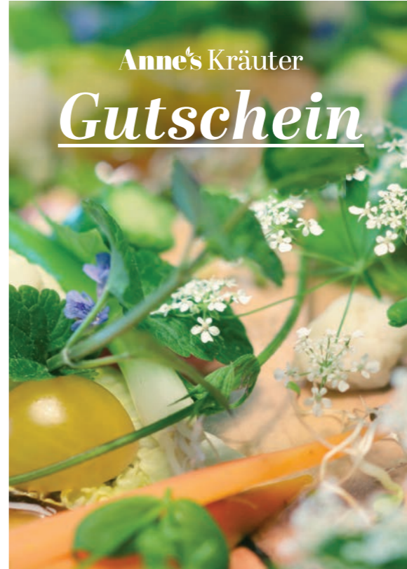
4 - „Wilder Garten“