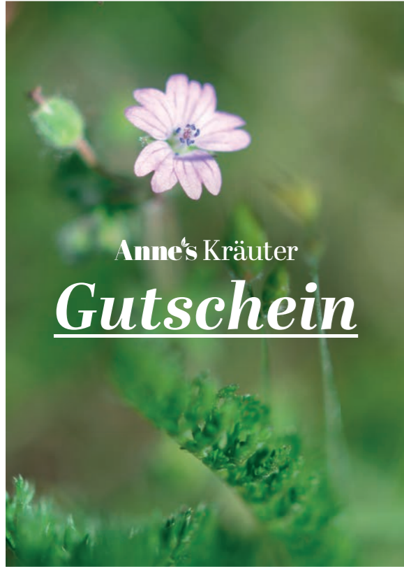
1 - „Blüte“